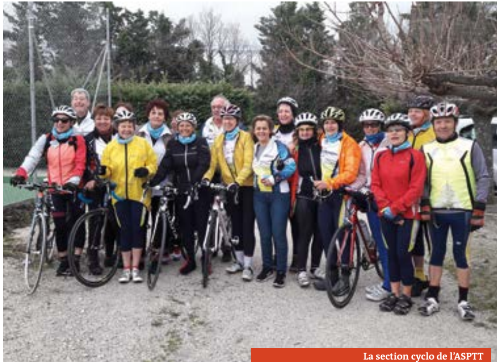
La section cyclo de l'ASPTT