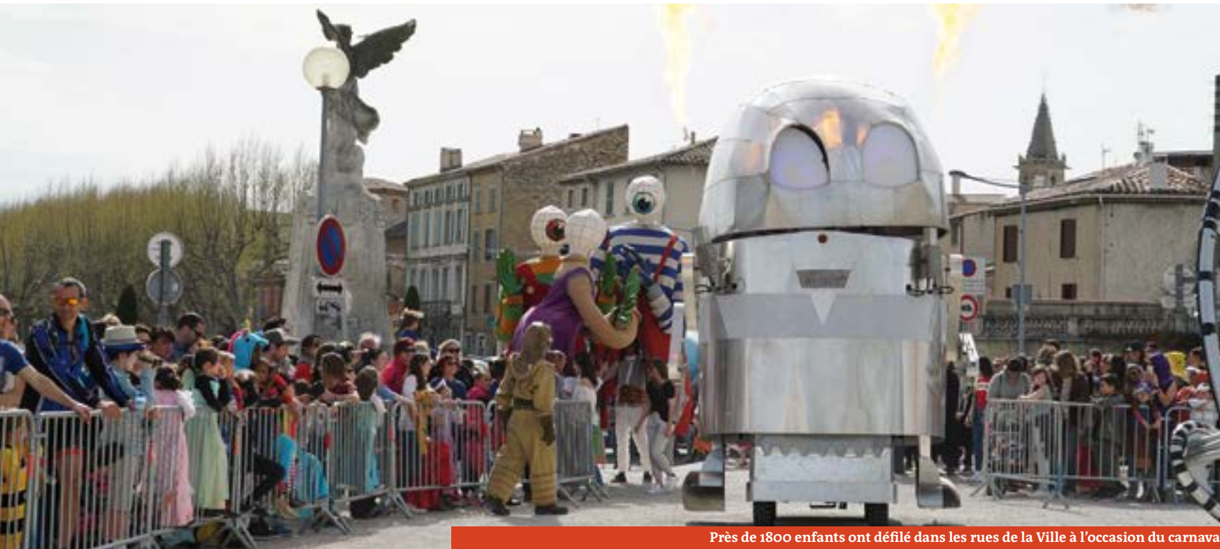
Près de 1800 enfants ont défilé dans les rues de la Ville à l'occasion du carnaval