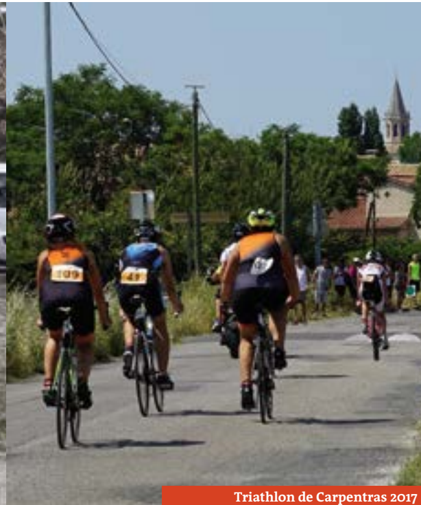
Triathlon de Carpentras 2017