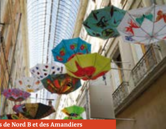
Préparation des parapluies par les écoliers de Nord B et des Amandiers