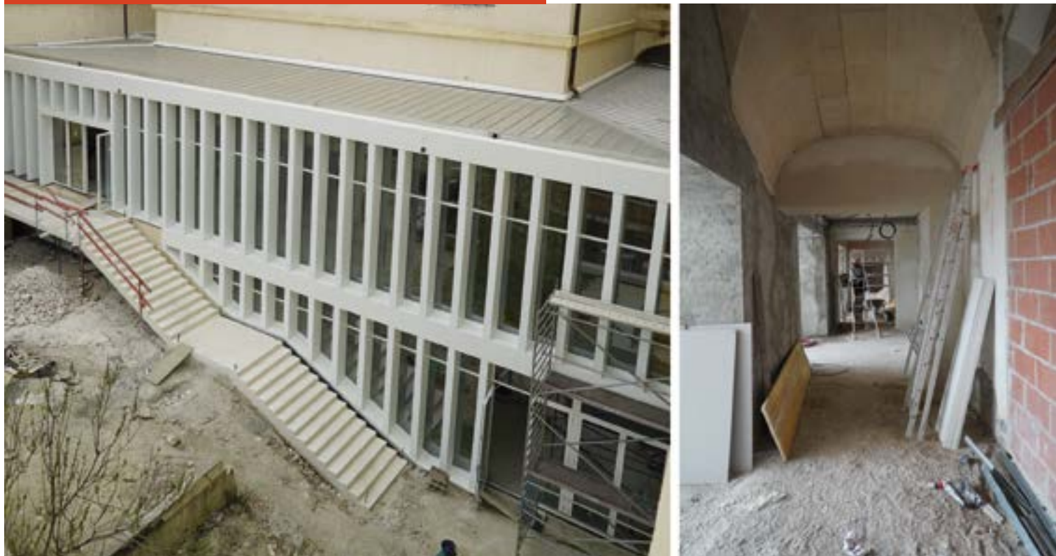
La verrière vue de l'extérieur et de l'intérieur

pour la tranche 1b, deuxième étape du chantier de l'Inguimbertaine