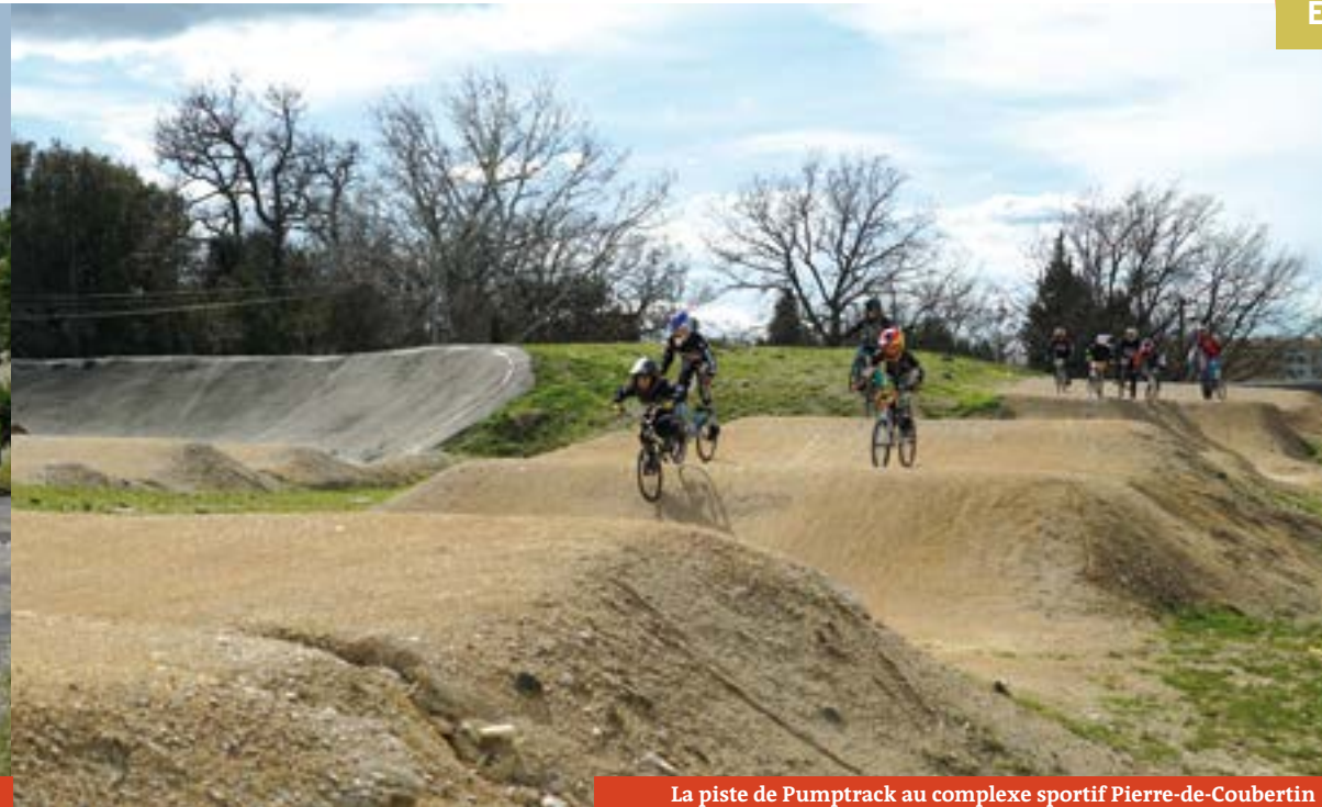
La piste de Pumptrack au complexe sportif Pierre-de-Coubertin

Un événement international exceptionnel pour les amateurs de cyclisme et de sports extrêmes va avoir lieu à Carpentras le week-end du 30 juin.