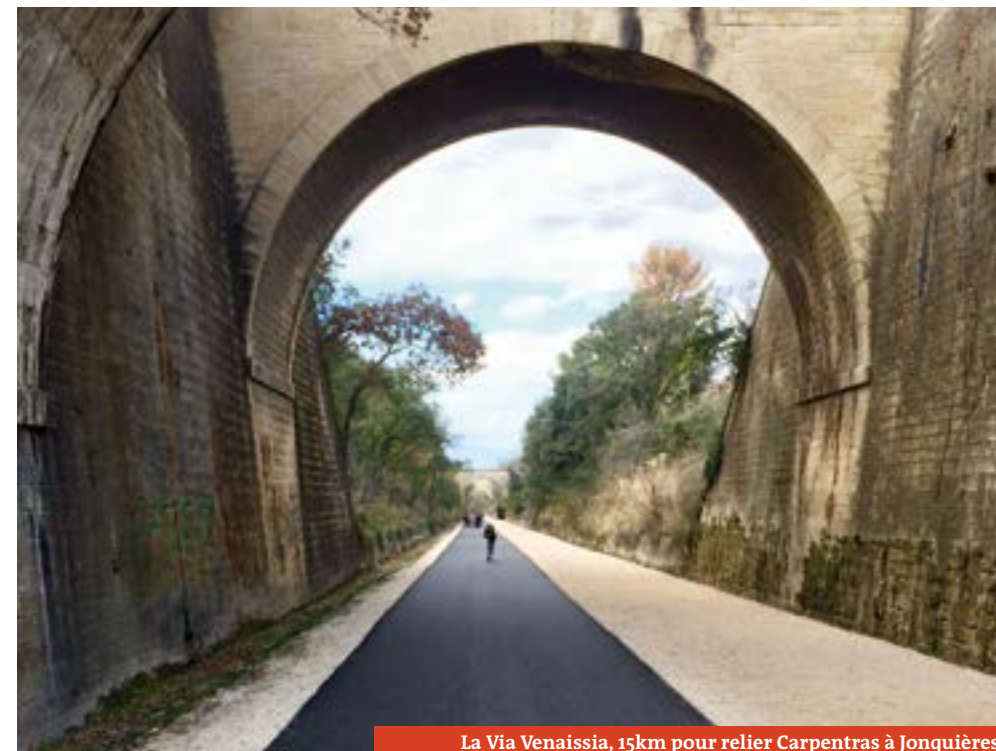
La Via Venaissia, 15km pour relier Carpentras à Jonquières

Que serait la pratique d'un sport sans ses licenciés ? À Carpentras, le cyclisme se pratique dans quatre clubs différents : les clubs cyclo-touristes de l'ASPTT et des randonneurs serrois Cyclo-Marche, le BMX Club mais aussi au sein du Ventoux Triathlon Club. >