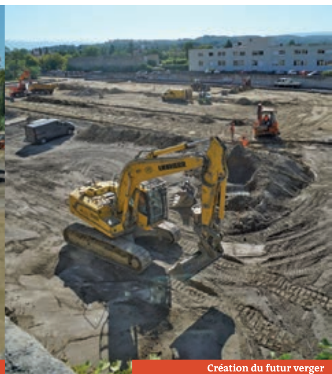
Création du futur verger

> Les automobilistes qui emprunteront cet axe seront limités en accès et en vitesse.