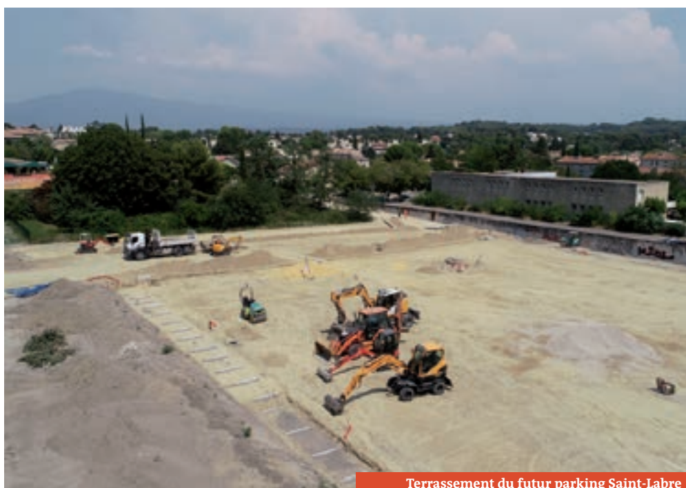
Terrassement du futur parking Saint-Labre

« Nous sommes intervenus dans un premier temps pour décaper le terrain, enlever tout ce qui restait de végétal. Nous avons ensuite mis du safre, un matériau qui demande un suivi rigoureux. En effet des prélèvements d'humidité et des essais de portance du sol ont été réalisés. Nous nous chargeons ensuite des réseaux. Pour les réseaux d'eau pluviale nous installons des buses en béton et récupérons l'eau dans un bassin. Nous réalisons ensuite les réseaux secs : éclairage public, fibre ville, ligne téléphonique qui serviront notamment à l'installation de l'ascenseur. »