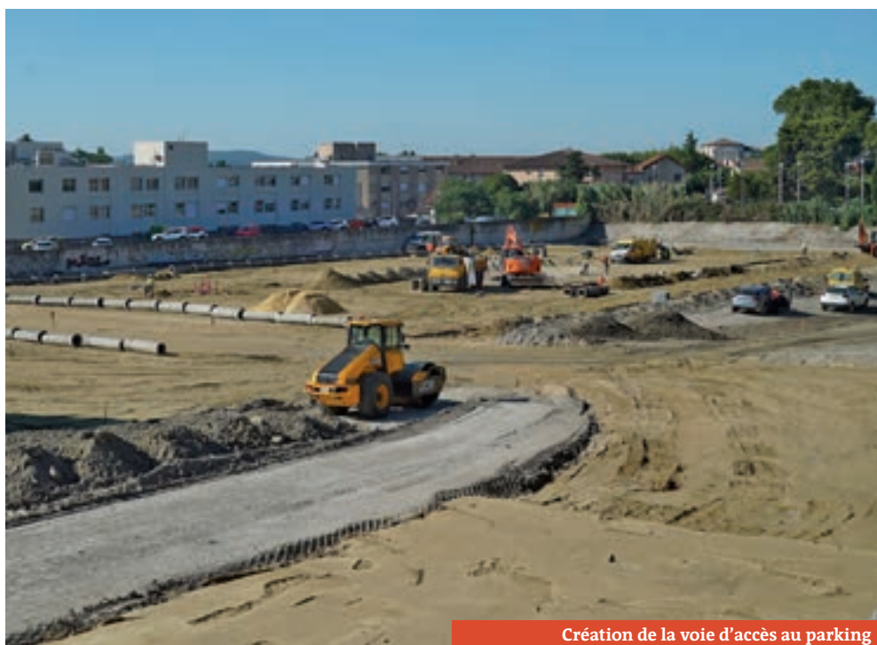
Création de la voie d'accès au parking