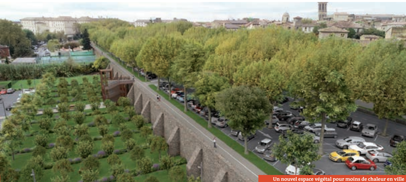
Un nouvel espace végétal pour moins de chaleur en ville