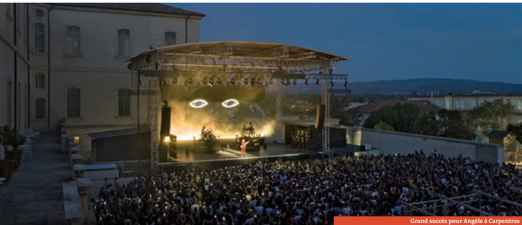
Grand succès pour Angèle à Carpentras

Les 11 et 18 juillet dernier, se sont déroulés les concerts événements de l'été à Carpentras. Les chanteuses Jain et Angèle ont pris d'assaut la cour de l'hôtel-Dieu. Retour sur deux soirées exceptionnelles.