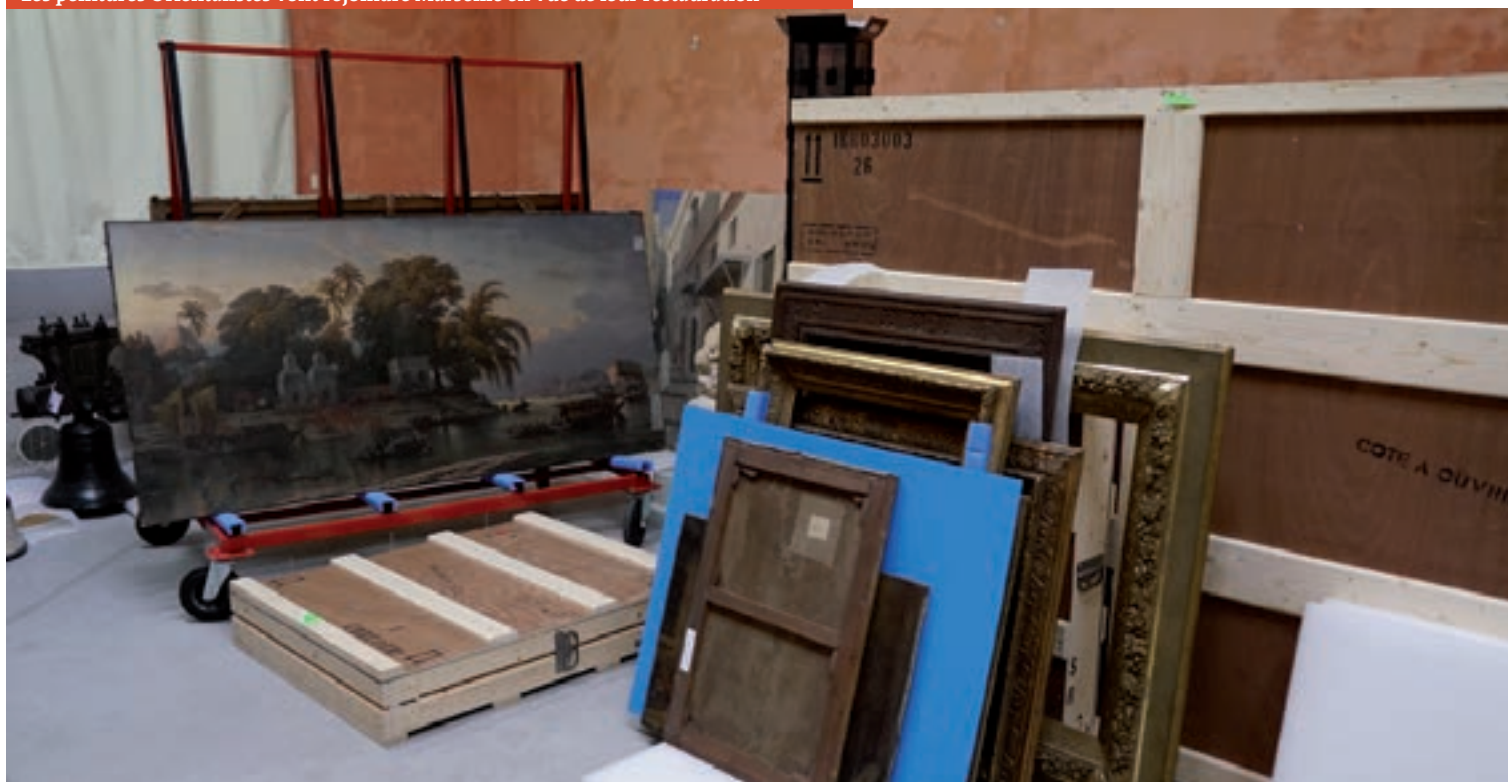
Les peintures Orientalistes vont rejoindre Marseille en vue de leur restauration

statues de plâtre ont été rénovées dans les ateliers de l'hôtel-Dieu