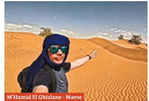
M'Hamid El Ghizlane - Maroc