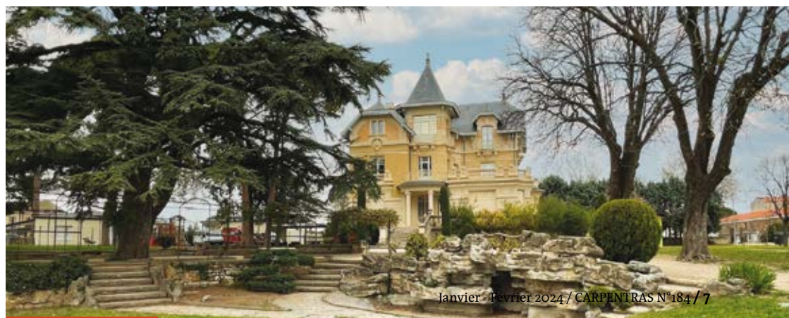
Château de la Roseraie