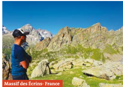
Massif des Écrins - France