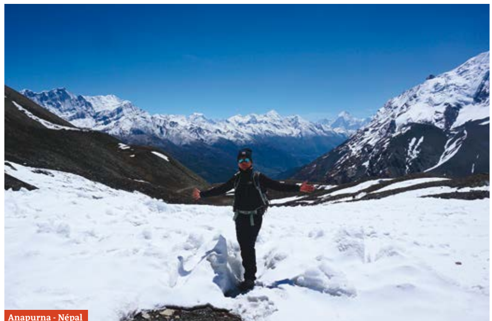
Anapurna - Népal