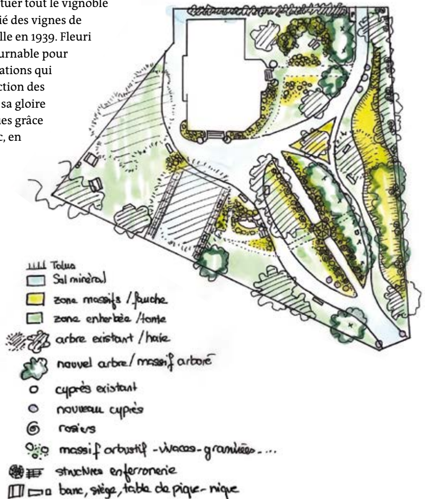
LA ROSERAIE - répartition espaces verts / minéral - version 3b - mai 2023

Assistante sociale à la retraite de la MSA, amoureuse des églantiers et dotée d'une sensibilité très forte à la qualité de l'environnement et au maintien de la biodiversité elle se dit en 2022 que ce lieu mérite mieux, il est bien placé et constitue un poumon vert pour la population. La bâtisse et son histoire doivent être valorisées, quoi de mieux qu'un beau parc fleuri et arboré pour en raconter l'histoire.